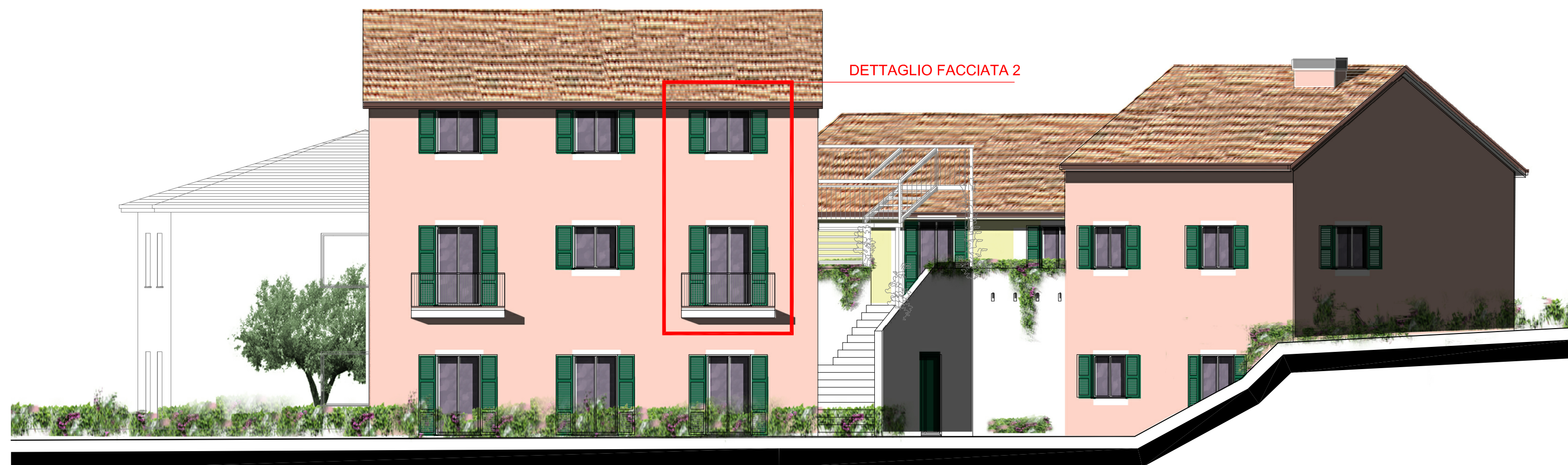
PROSPETTO LATERALE - fronte rivolto ad est_sc. 1:100