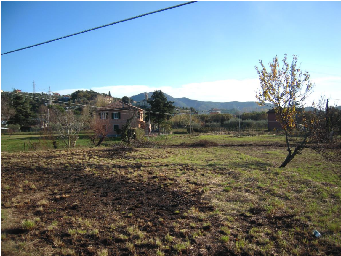
vista da area interessata verso S. Vittoria (ad est)_foto 10