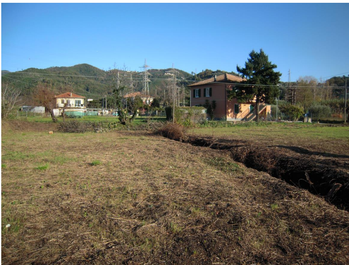
zona destinata a parco verde - piscina_ foto 4