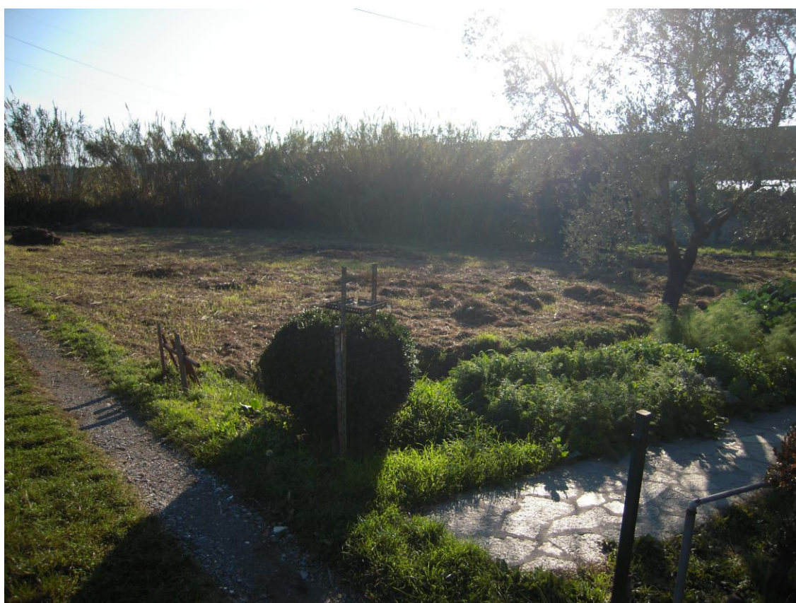
zona destinata a parcheggio - gioco e verde di rispetto_foto 6