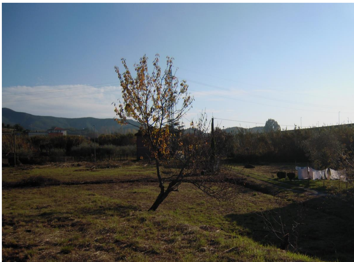
vista da area interessata verso Sestri Levante (a sud)_foto 12