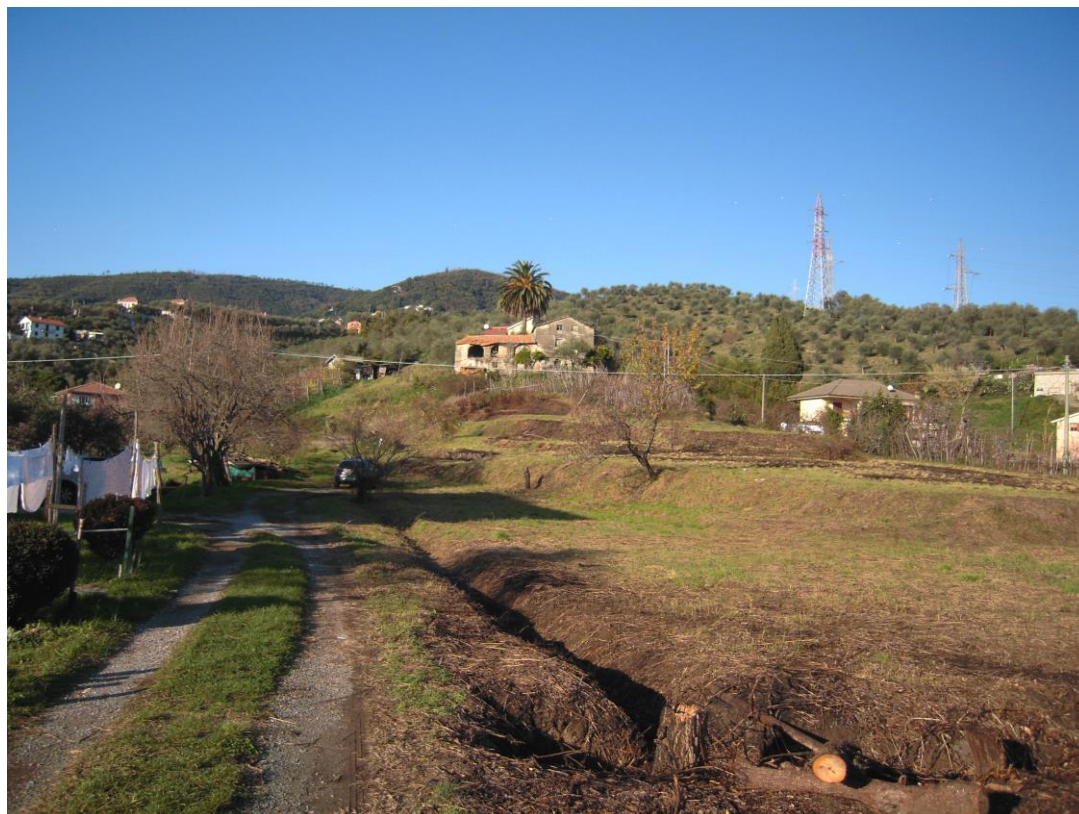
area interessata dall'intervento_foto 1