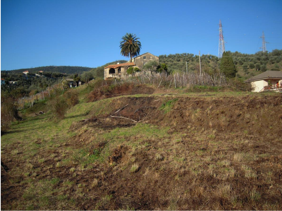
zona a monte all'area destinata al nuovo fabbricato (verso nord)_foto 9