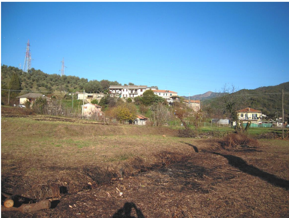
area interessata dall'intervento_ foto 3