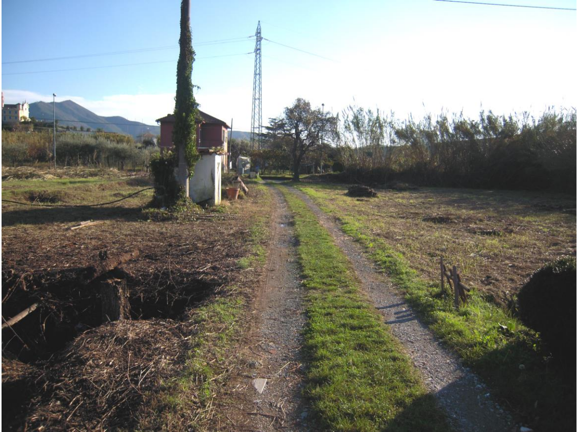
strada di accesso alla struttura ricettiva esistente_ foto 7