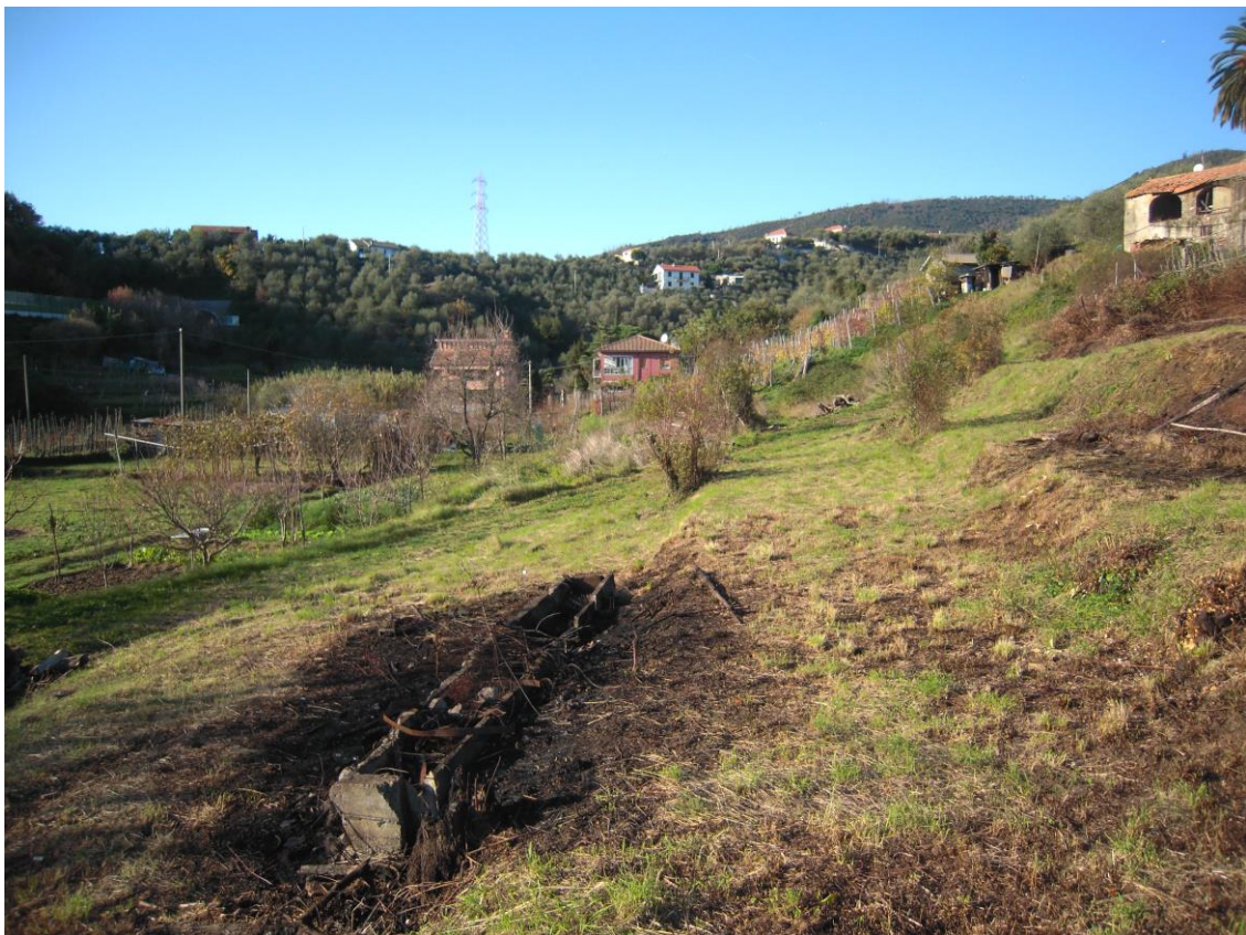
zona a monte all'area destinata al nuovo fabbricato (verso nord)_ foto 8