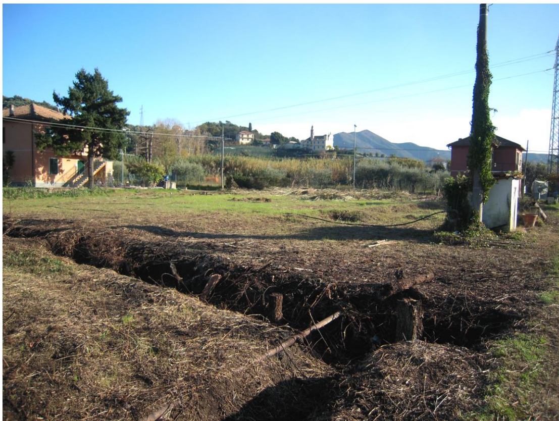
zona destinata a parco verde - piscina_foto 5