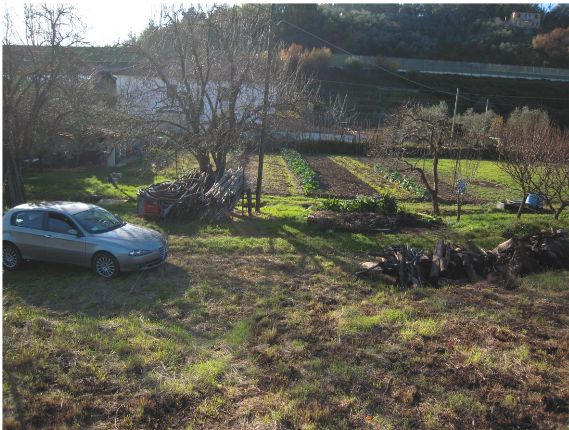
vista da area interessata verso autostrada (ad ovest)_foto 11